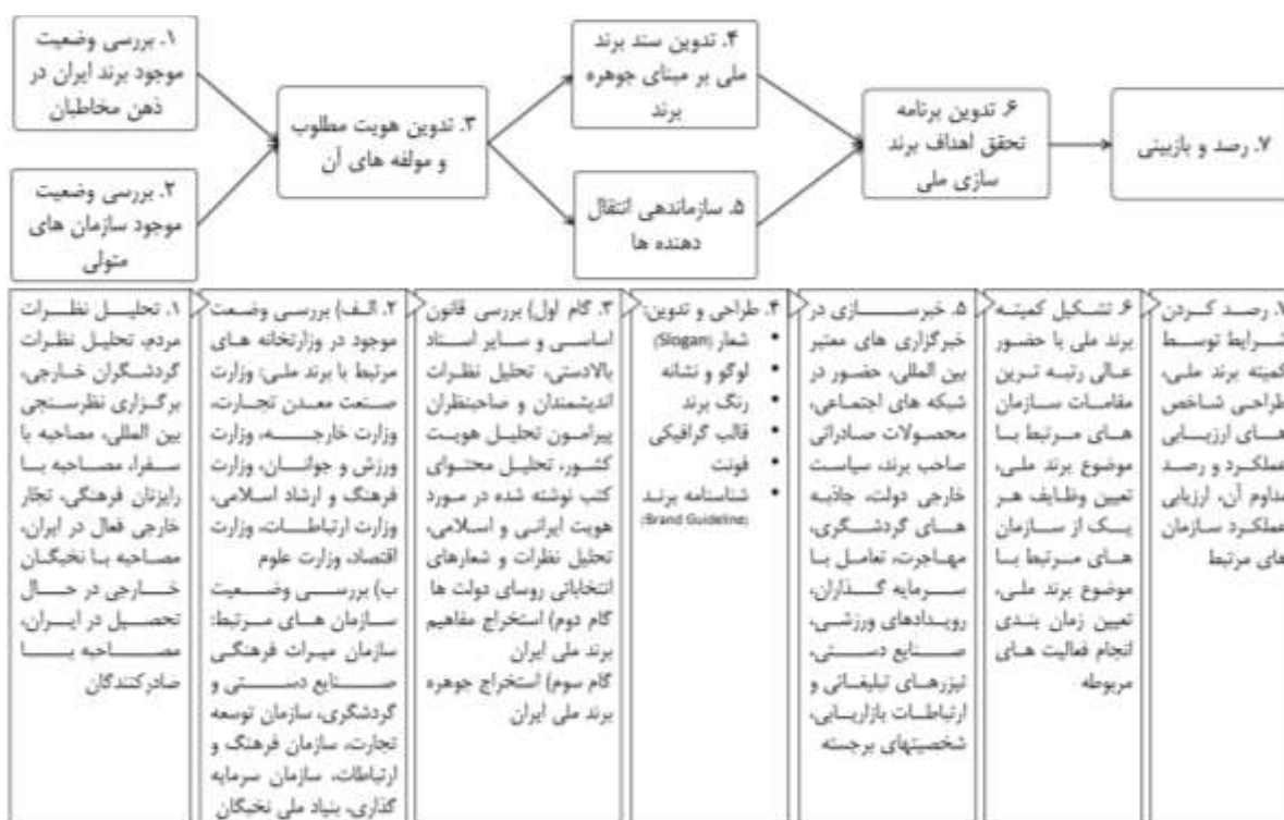
شکل ۳: مدل نهایی برندسازی ملی ایران و مولفه های آن