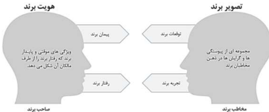
شکل ۱. ارتباط میان هویت برند و تصویر برند

کلیشه‌ها و دیدگاه‌های سطحی درباره یک ملت می‌تواند بر ادراکات و تصورات موجود نسبت به آن ملت تأثیرگذار باشد و این تصورات می‌تواند گاه بر جایگاه یک ملت ضربه وارد کند. از این رو، هدف اصلی و رسالت برند ملی شناسایی چنین فاصله‌هایی (فاصله میان هویت و تصویر از یک کشور) و کمک به ملت‌ها در مقابله و خاتمه دادن به آثار منفی آنها است. آثاری که حتی ممکن است موجب رکود اقتصادی و عقب‌افتادگی آن ملت شود. برای مثال دولت کرواسی پس از وقایعی چون پایگاه قرارگرفتن برای حزب نازی در جنگ جهانی دوم و جنگ‌های خونین دهه ۱۹۹۰، فعالیتی همه‌جانبه را برای جانداختن نام کرواسی در دنیا و تغییر نگرش جهانیان آغاز کرده‌است. هدف کرواسی ارائه سیمایی به‌عنوان یک کشور عادی با اقتصادی بازاری، دموکراتیک، دارای شهرهای زیبا و نیروی کار ارزان است. کشور فنلاند فعالیت‌های گسترده‌ای را آغاز