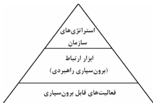
شکل ۱: برون‌سپاری راهبردی، ابزار ارتباط

برون‌سپاری راهبردی در واقع، با نگاه به مأموریت‌های اصلی سازمان و راهبردهای کلان، ابزاری برای ایجاد ارتباط بین استراتژی‌های سازمان و فعالیت‌های قابل برون‌سپاری در سازمان است (شکل ۱). هدف آن است که در قالب این چارچوب به تشخیص بخش‌هایی که قابلیت برون‌سپاری و سرمایه‌گذاری با استفاده از متدولوژی پیشنهادی که کاهش ریسک را در بر دارد پرداخته شود.