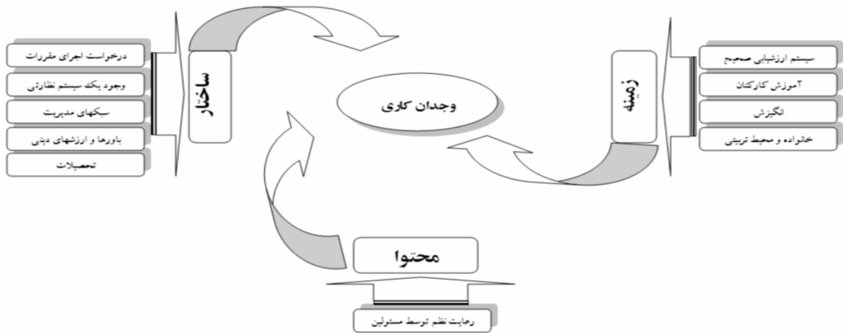
نمودار(۱): مدل مفهومی تحقیق